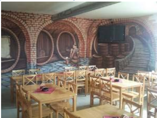
V pivnici Pivovaru Moravský Žižkov

K jižní Moravě neodmyslitelně patří víno. Rozlehlé vinice se tady dnes rozkládají na cca 12 000 hektarech půdy, a z nejrůznějších oblastí a podoblastí Jižní Moravy pocházejí ty nejkvalitnější a nejocetovanější vína z celé České Republiky. Stále zde vznikají nová vinařství, ale jakoby se najednou zdálo, že vína už bylo dosti, vzniklo na Jižní Moravě v posledních letech i několik malých soukromých pivovarů. Jako třeba v Moravském Žižkově, kde o uplynulém víkendu otevírali malý rodinný pivovar.